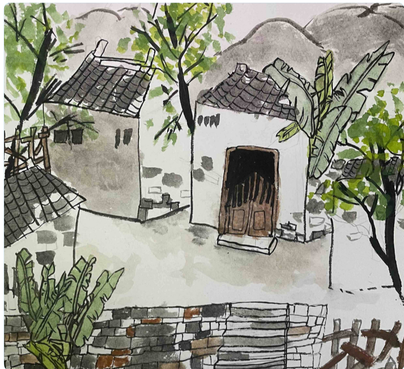
乡野 定海舟岷小学三(3)班 小记者 顾旭语(证号E0513)

吃过了栗子,去过了溪坑,抓过了蝗虫,见过了鞭蝎,我们才依依不舍地向老家告了别。想到这里,我想去老家的心更加迫切了,决定今晚就向爸爸妈妈提一下这个建议。