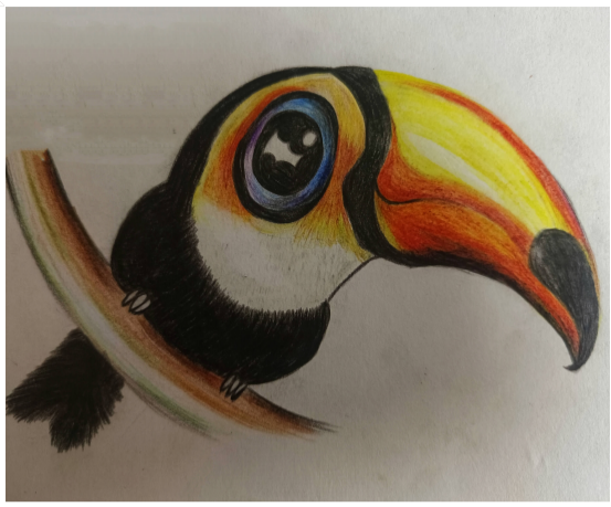
大嘴鸟 沈家门第四小学四(一)班 小记者 张雨薇(证号B07033)