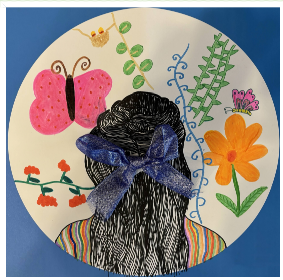
我的妈妈 舟山二小一(5)班 小记者 姚晴凤(证号C09021)