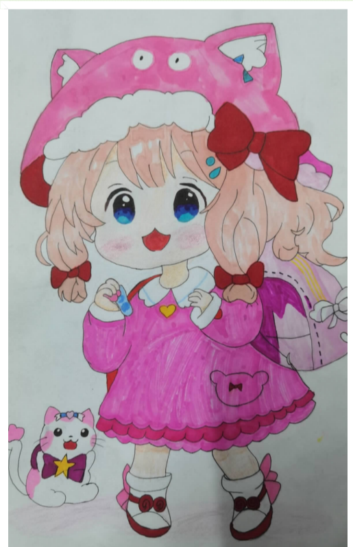
女孩和猫咪 舟山一小北校区二(2)班 小记者 苏思瑶(证号C22055)