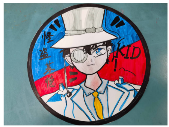
怪盗基德 普陀小学一(13)班 小记者 章程皓(证号B01102)