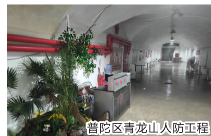
普陀区青龙山人防工程