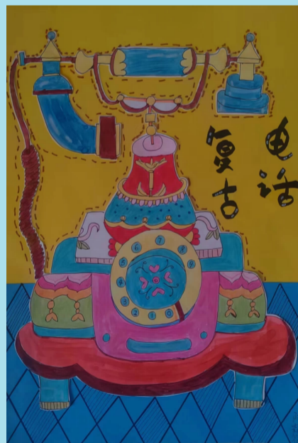
复古电话 檀枫小学东校区二(2)班 小记者 陈霖筱(证号E0406)