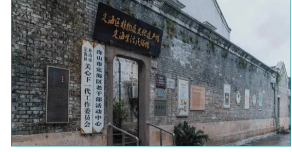
定海区非物质文化遗产馆