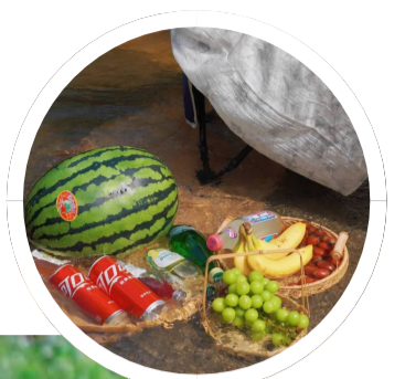
游客溯溪带的水果