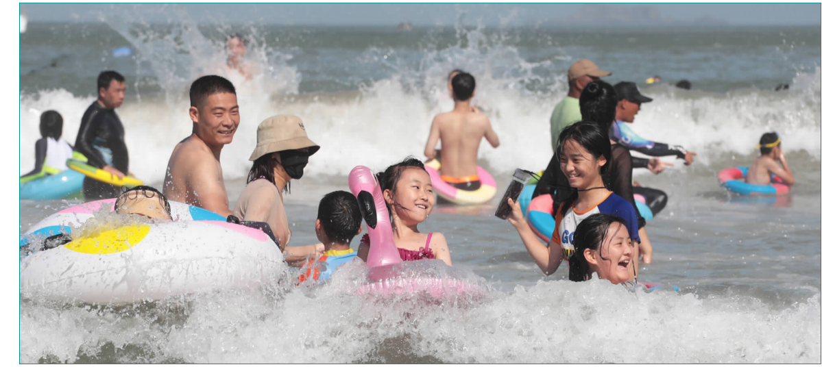
游客在朱家尖南沙景区戏水