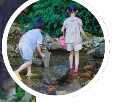
寺岭村溪流中捞鱼