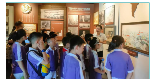
舟山鸦片战争纪念馆