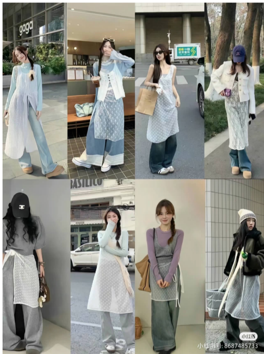
裙帘穿搭

时尚就像一阵风，总是让人难以捉摸方向。这不，今年春夏，年轻人的衣柜里又多了“新玩意儿”。找个周末走上岛城街头，你不难看见一些过往不曾见过的穿搭风格，有些当下热门的穿搭单品让人直呼“看不懂”：围在牛仔裤外的蕾丝裙帘、乡村气息满满的法式三角头巾、软木做底的勃肯鞋、几乎人手一条的白色蛋糕长裙……这些穿搭有人吐槽丑，有人觉得潮，但岛城年轻人依旧没有停下追逐时尚的脚步，不断尝试用新鲜感点缀生活。