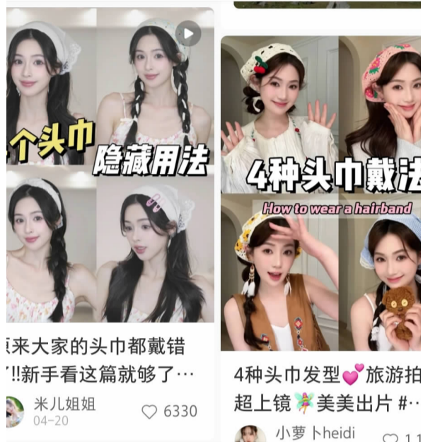
网友们分享的头巾穿搭