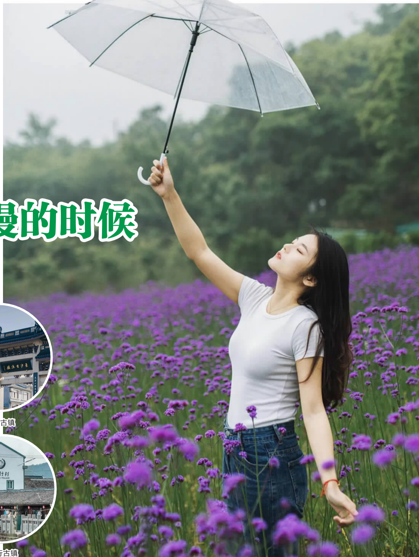
普陀青石子度假庄园花海