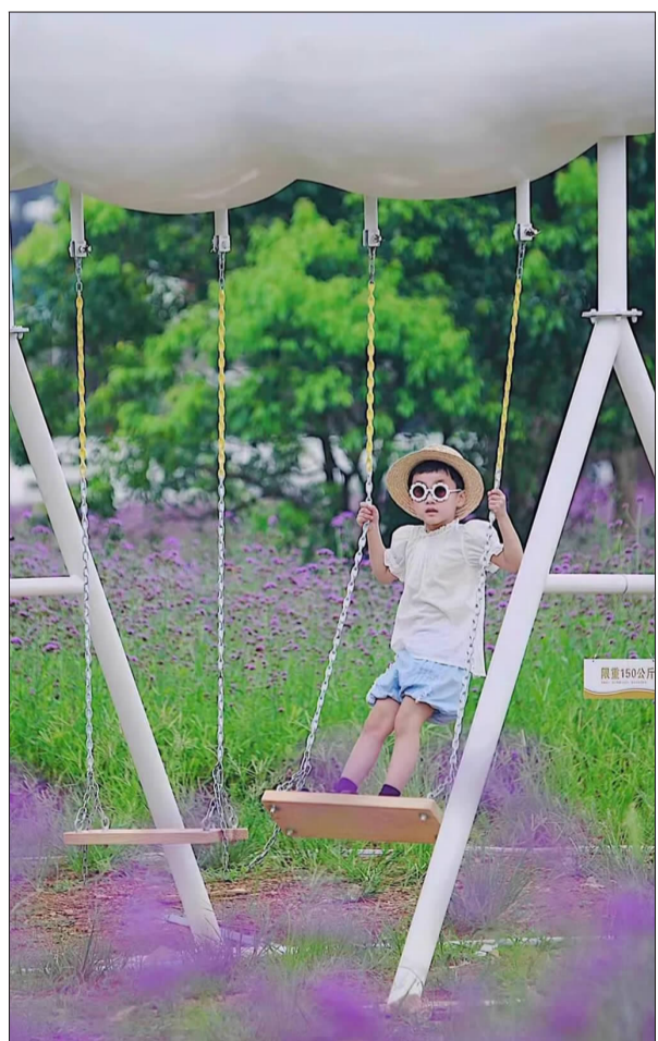
普陀城北客运站东侧马鞭草花海

想要拍出盛大的花田，那就要尽量把大面积的花田融入画面，可以用广角镜头纳入更多的花海，人物站在花海中作为一个点缀。如果不想露脸，那就抓住属于身上的闪光点，或是手指、或是眼睛、或是肩膀，随手一拍都很有意境和唯美感。