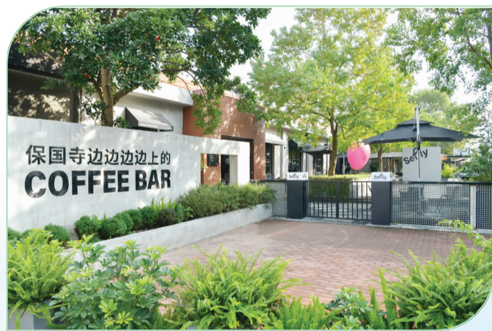
保国寺旁的网红咖啡店