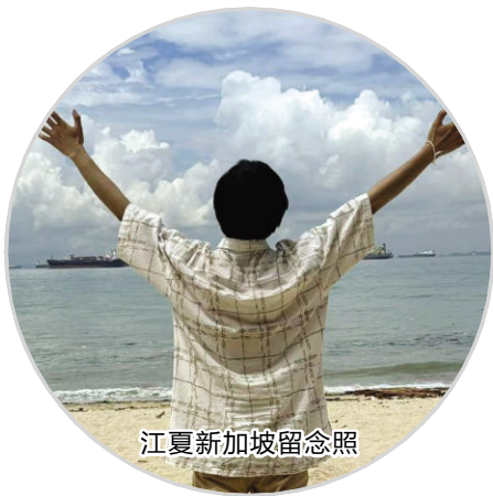
江夏新加坡留念照