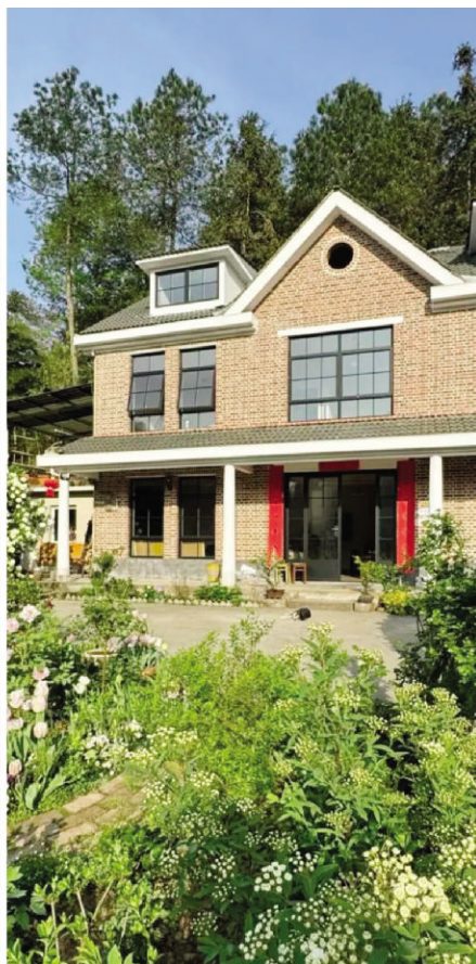
花园和自建的红砖房