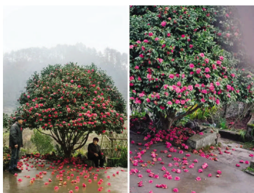
爷爷青年时期种下的三株茶花，是院子的骨架，已经默默陪伴这家人四十多年

他四十年前爱上了茶花，有同事弄了一株小芽给他，他小心翼翼地种下，结果被家里养的猪拱了，“我说糟了糟了，心里太难受了。”后来他一直念念不忘，又去乡下扦插了三株回来。从此这三株茶花在院子里冬去春来，每年腊月后盛开。盛花期的时候，落花在树下积了厚厚的一层。爷爷爱这些山茶，一开始总舍不得扫。到后来堆得实