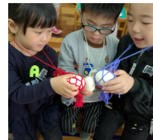
立夏当天,小朋友互相“斗蛋”

如果想要煮出其他颜色的鸡蛋,可以用马苋菜、紫甘蓝等蔬菜放进水中和鸡蛋一起煮就可以了。通过这些天然材料就能做出各种颜色的水煮蛋了。