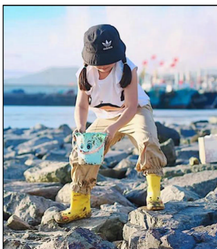
小朋友在朱家尖西吞隧道附近赶海