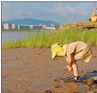
小朋友在吞山大桥下赶海