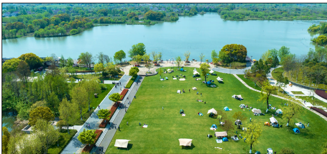
南太湖新区长田漾湿地公园