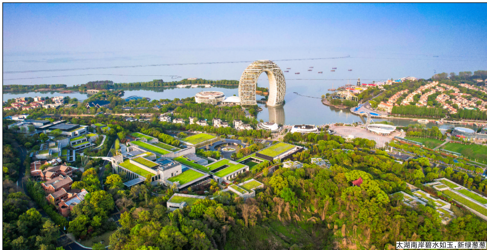
太湖南岸碧水如玉,新绿葱葱