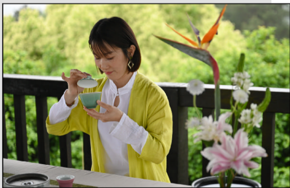
邱城遗址公园内的茶园,体验采茶品茶的乐趣