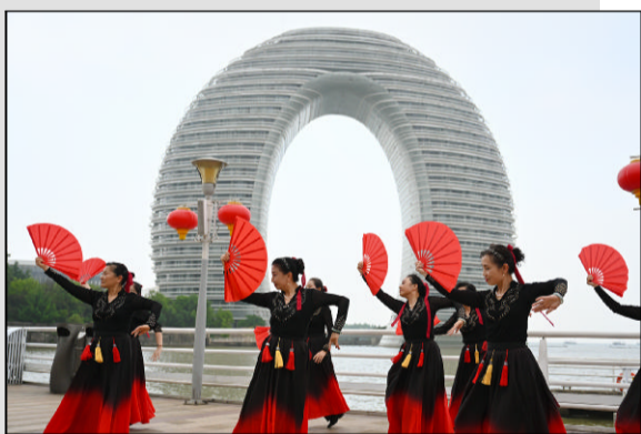
南太湖畔的幸福生活

登临吴亭、越台,茶竹园、古窑址及赵孟頫与管道升雕塑等景观尽收眼底。远眺南太湖,在湖光山色中体验到的是传承千年的古韵魅力。