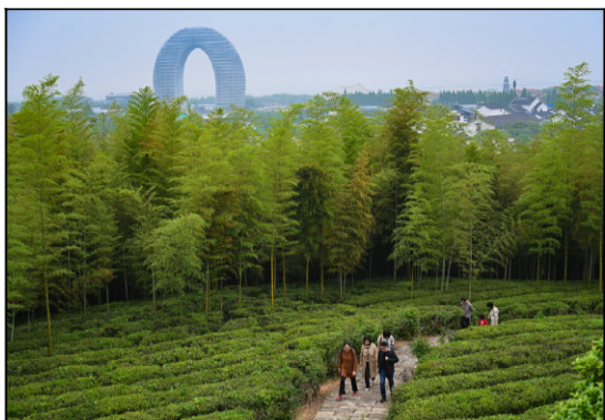
位于南太湖新区的邱城遗址公园