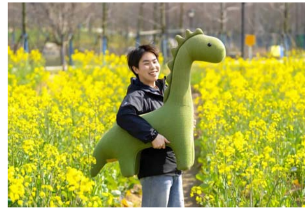
游客在东海郊野公园打卡游玩