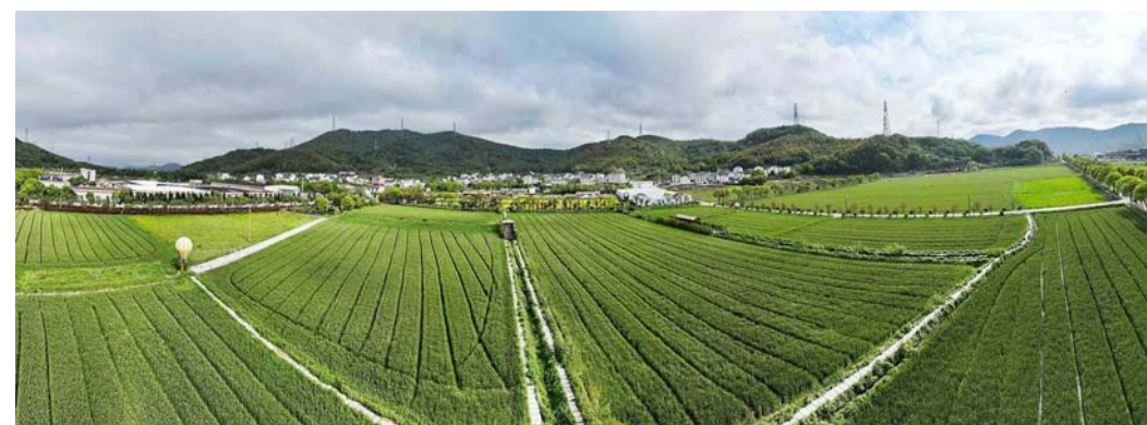
定海区小沙街道东风村，连片的麦田绿意盎然，呈现勃勃生机