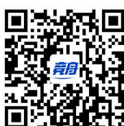
(内容来源竞舟客户端)