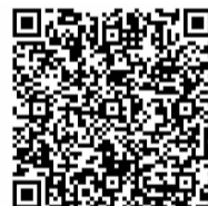
(内容来源竞舟客户端)