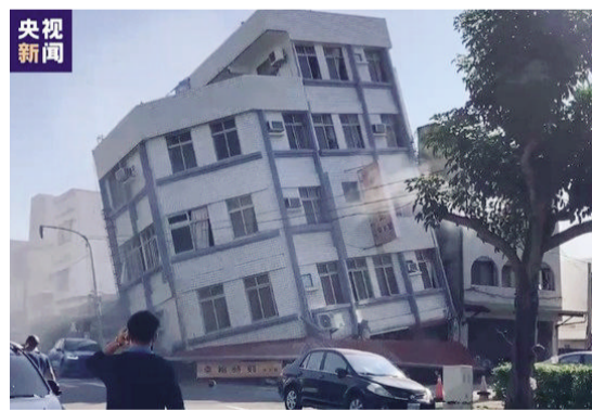
受地震影响，花莲一大楼出现倾斜

杨屹洲还建议，除了周边地震对舟山有影响，舟山本身也有发生地震的可能，灾难几率虽然小，但防灾意识应人人具备，增强自我保护意识，为生命安全多增一道保护。