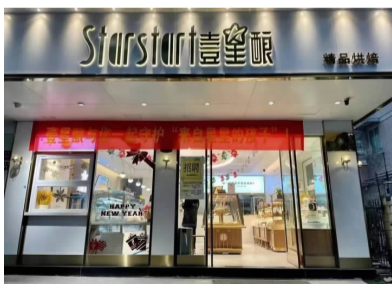
温州壹星酿烘焙房。

在温州，有一家非常特别的面包烘焙房“壹星酿”，里面部分咖啡师、烘焙师、服务员是“星星的孩子”。