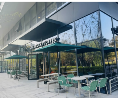
浙江首家星巴克心智障碍融合就业门店。