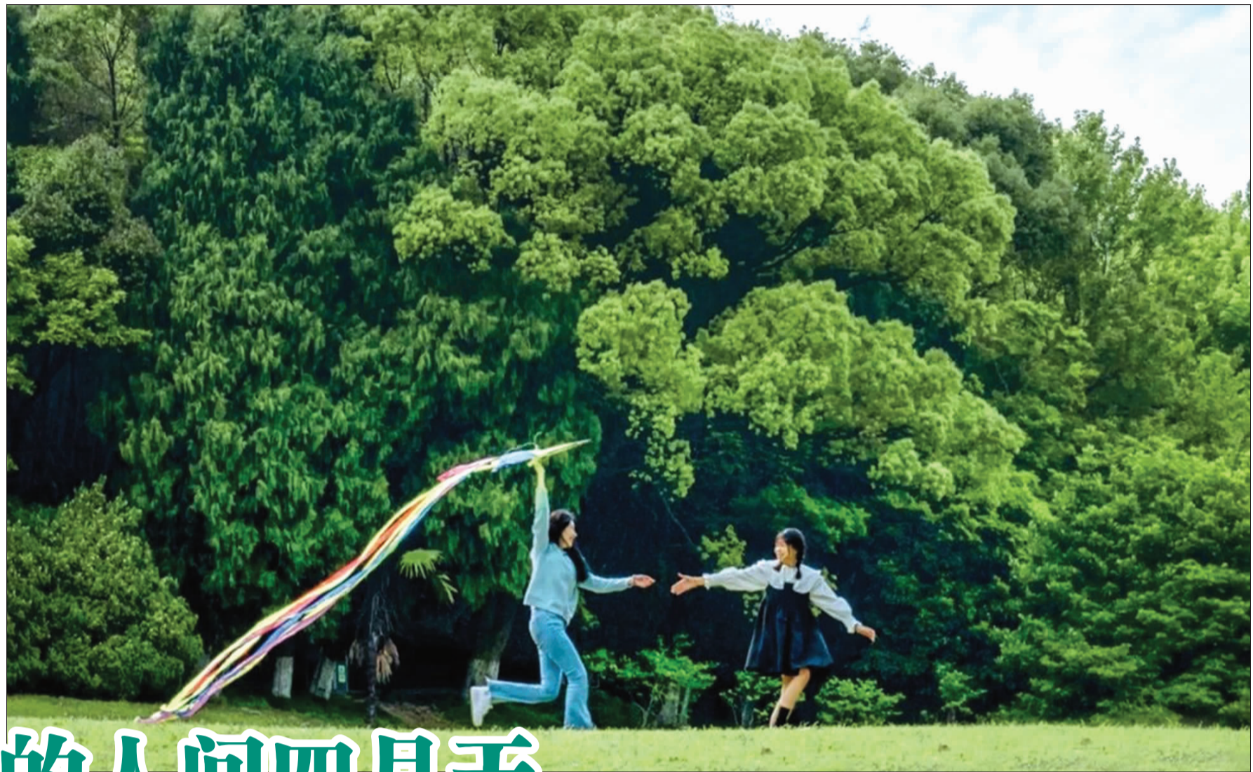
东海云廊海山段的海山公园，游客举起风筝，跑进温柔的春天里