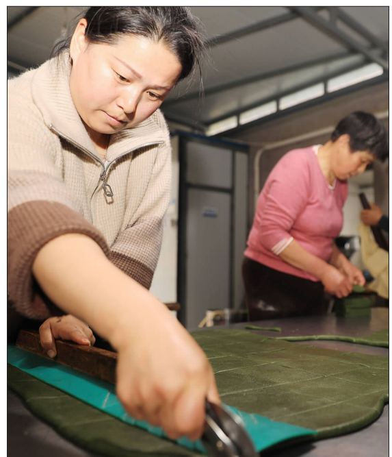
清明时节制作金塘麻糍