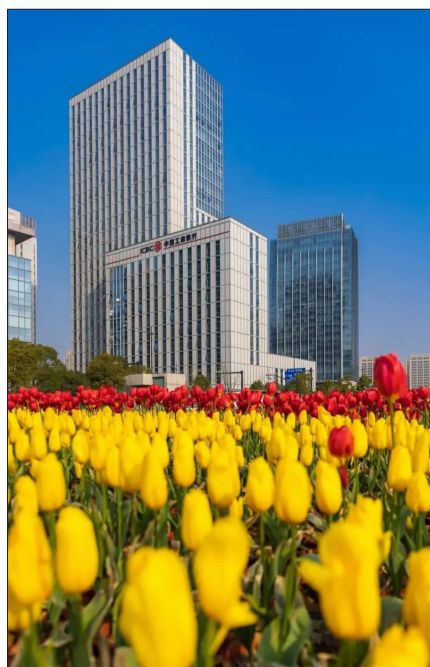
岛城郁金香花开正旺