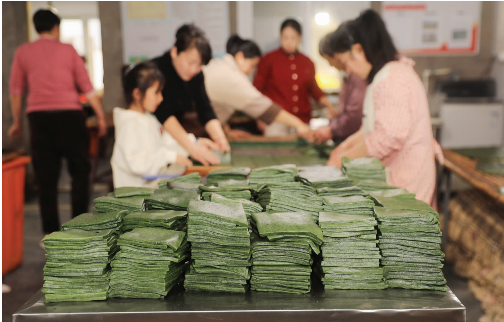
在加工区一桌面上，堆满了刚制作好的麻糍