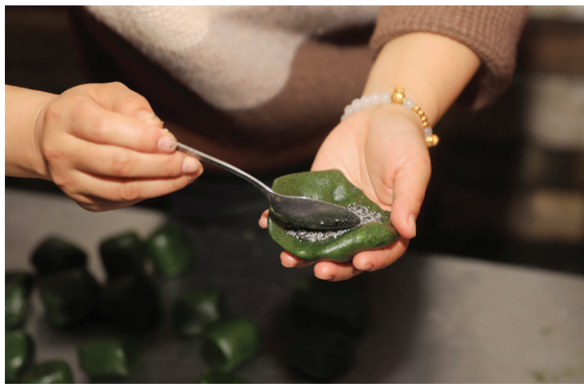
村民在制作芝麻桂花白糖馅青饼