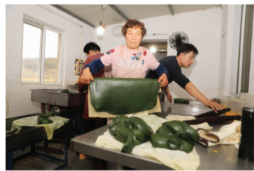
村民在工坊生产加工区忙碌