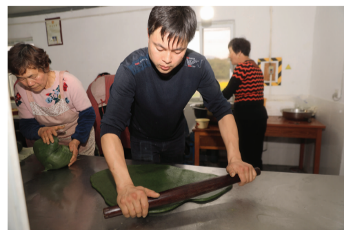
村民将青饼团压成片状，方便包装运输