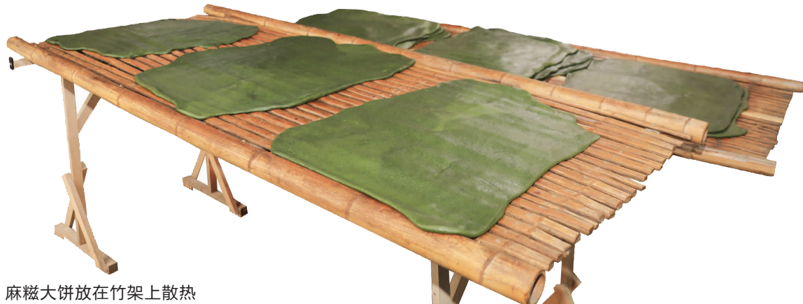
麻糍大饼放在竹架上散热