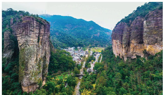
山中小村犹如世外桃源