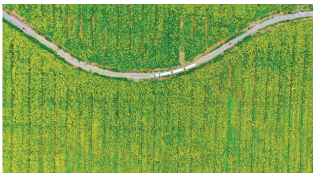
乐清都市农业公园