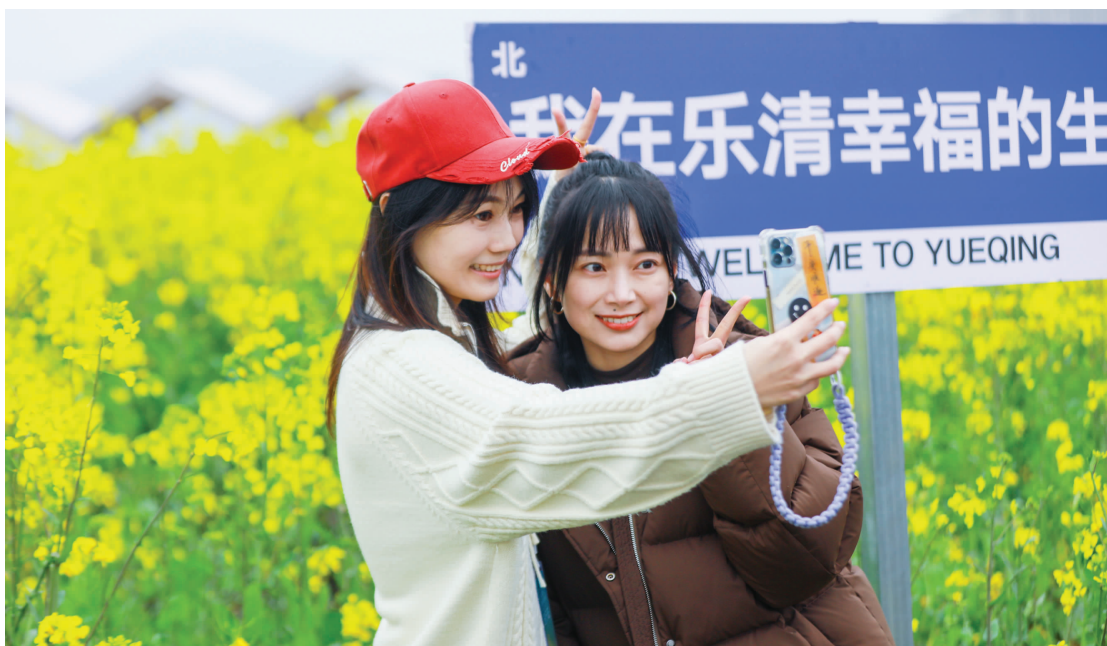
乐清都市农业公园