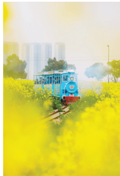
乐清都市农业公园小火车花丛中来