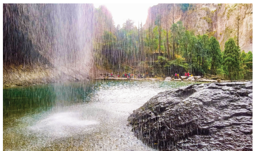
雁荡山大龙湫景点