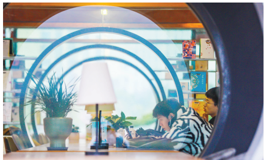
清和书苑看书的市民