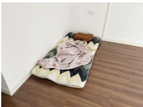
咸鱼的出租屋里,最初只有一张床垫