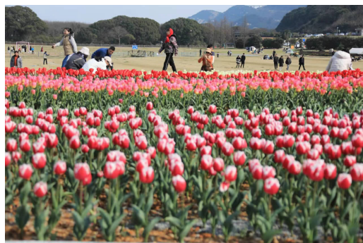
大青山郁金香

除了郁金香本身,大青山还有不少适合拍照的置景,如具有英伦风情的红色电话亭、满载仿真花卉的小推车、艺术感十足的风车等。上周末,已有不少市民去了大青山打卡郁金香花海,在线上社交平台交出打卡“作业”。趁着花期未过,不如约上三两亲朋,登山赏花。