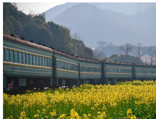
定海南洞艺谷油菜花田 (网友@象牙塔里的小姐姐)

如果愿意抽出时间去周边小岛走走,金塘岛西北大鹏岛上的油菜花田也许不会让你失望。吹着海风漫步这座有着“海上周庄”美誉的乡野小岛,一边是广阔的滩涂,一边是金色花田,不远处还有黛瓦石墙、具有孔孟之韵的古民居散落其间,带来在舟山鲜见的江南水乡气息。大鹏岛位于金塘岛西北,上岛需要在定海沥港渡运站乘船,船程约6分钟。这两天岛上的油菜花已经部分开放,预计再过一周就能全部盛开。