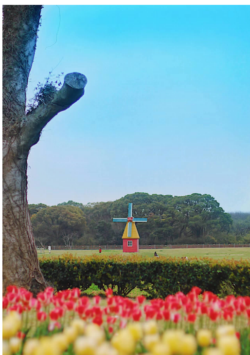
大青山郁金香(小红书网友@丁哈皮)