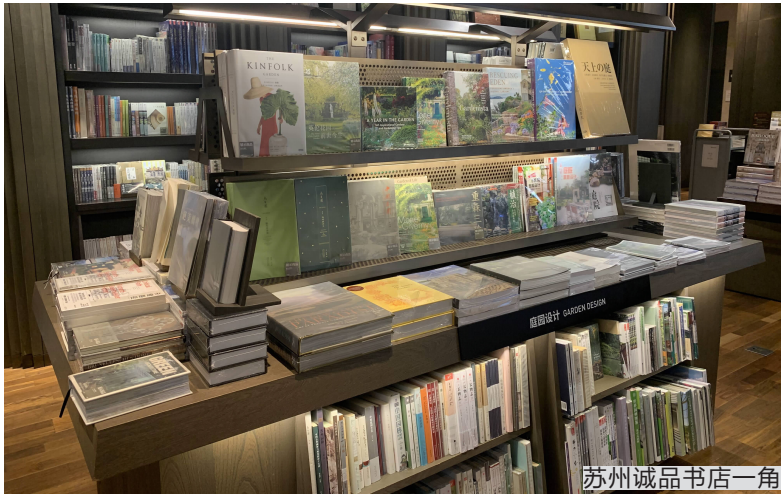
苏州诚品书店一角

2024年也是马尔克斯去世十周年。日前，记者从新经典获悉，马尔克斯遗作《我们八月见》简体中文版