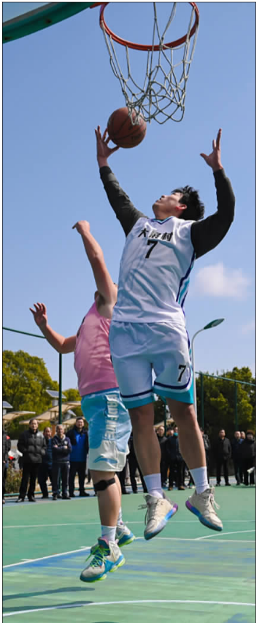
大展村队员“大展”身手