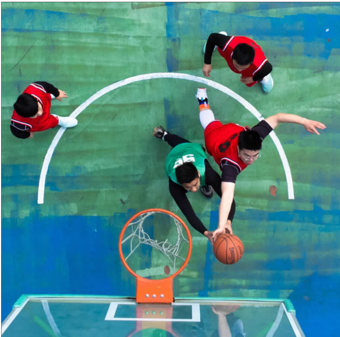
篮下激烈拼抢