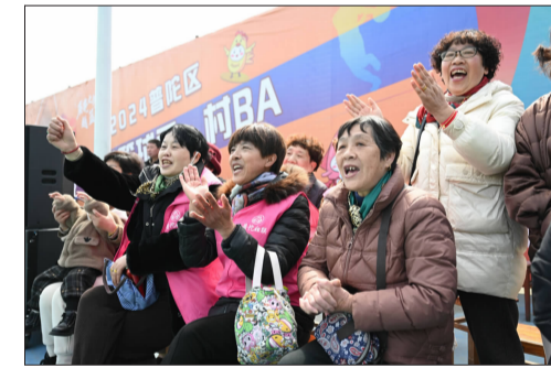
“大妈”球迷为参赛队员呐喊助威