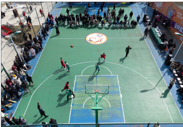
3月7日,普陀区“全民篮球季”·村BA揭幕战在展茅螺门渔家广场开启

当天,沈家门街道、东港街道、六横镇、桃花镇、虾峙镇、蚂蚁岛、登步岛等同步开启首场分站赛。本次普陀区“全民篮球季”·村BA共有85支球队、350余名球员参赛,一股“全民篮球风”将持续燃爆普陀的这个春天。