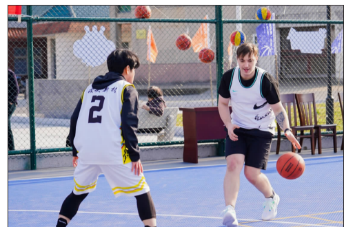
六横分站高山村赛场,来自本地船厂的外籍选手与村民同场竞技