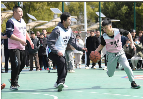
梁横村队员持球突破