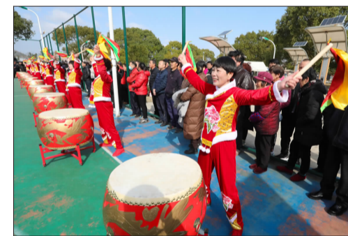
村里锣鼓队为参赛队员擂鼓助威