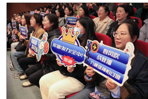
六横球迷在现场为球队加油