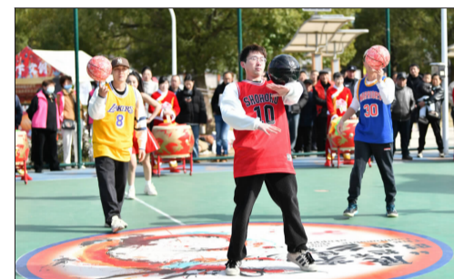
比赛开始前的花式篮球表演