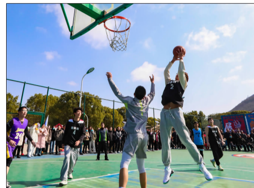
飞身上篮