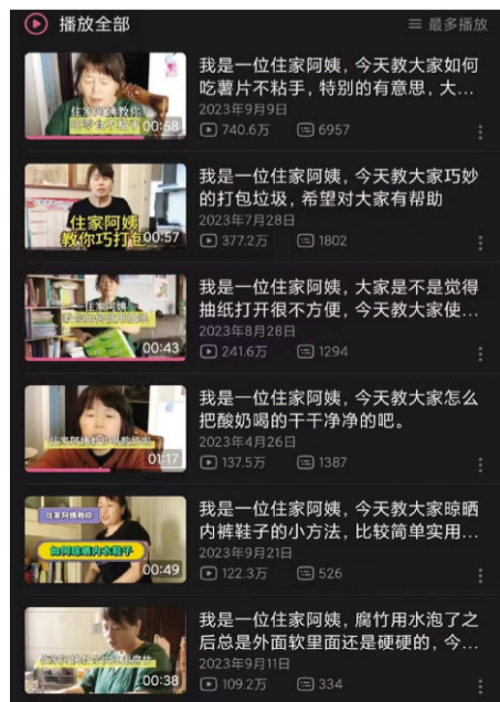
吴阿姨的视频内容很“接地气”