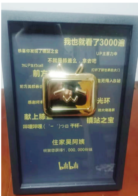
吴阿姨的B站百万粉丝牌