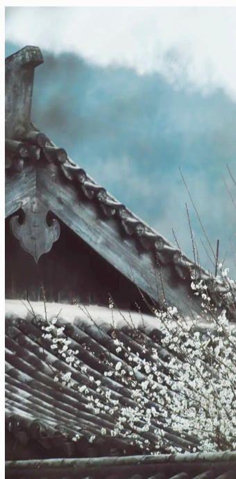
普陀沈院(舟山群岛旅游)