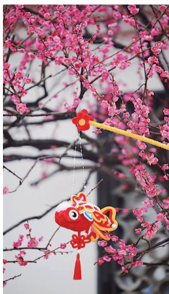
新城梅园公园 (小红书网友@丁哈皮)

近日出门虽然仍是寒气逼人,但悄然间开满枝头的梅花已将春信带到。比起三月早樱的柔嫩轻盈,梅花则多了几分坚韧与端庄。舟山出名的赏梅地有不少,记者整理了一份本岛赏梅路线,想要品味那一抹“雪中春信”的市民朋友们可以前去一探。