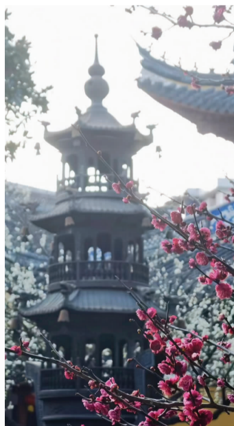
定海祖印禅寺

此外,沿着文廊、云廊漫步,也不难在山间找见盛放的梅树,冬季山景缺少绿意,梅花的盛放则带来了独属于冬日的烂漫野趣。