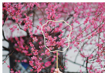
新城梅园公园