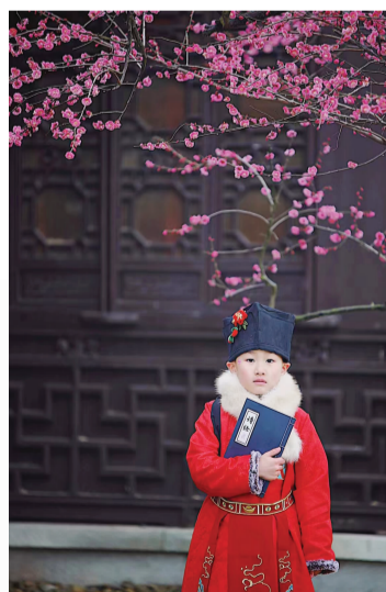
新城梅园公园