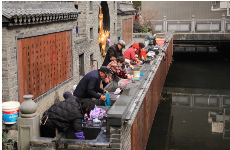
2月8日,定海区白泉镇万金湖路旁,村民们利用晴好天气忙着在“生态洗衣台”上刷洗衣物、家什,干干净净过大年