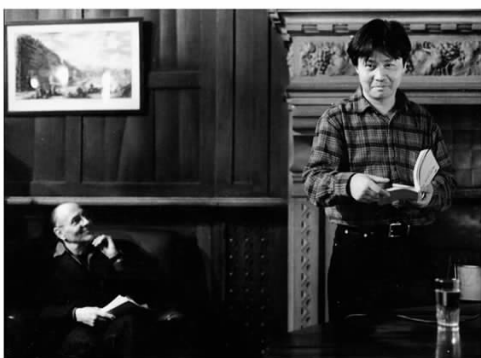
YU HUA IN PARIS, 2004.

近日,《巴黎评论》(The Paris Review)刊发了一份余华给学生的推荐读物,这份清单包含15个短篇小说与11个中篇小说。