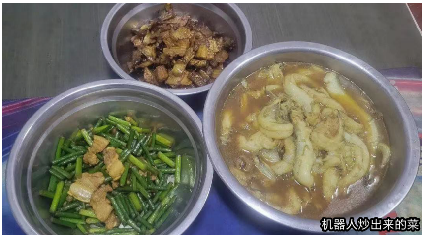
机器人炒出来的菜

现如今，渔民做饭普遍使用燃气灶，如果经常不规范使用、软管老化不更换，容易存在安全隐患，因此如何做好渔船厨房防火工作，一直都是重中之重。