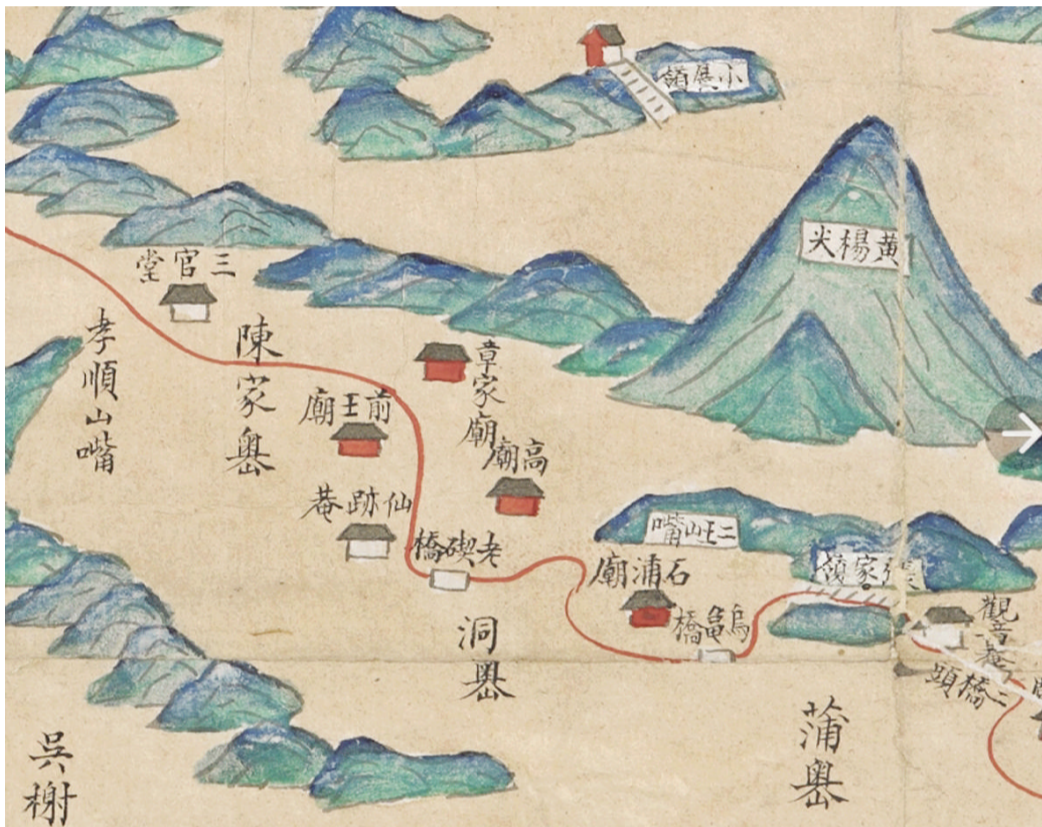
清代道光年间定海地图(局部)中的老石头

有些石头门，石眼多，最多的就是勾山的“九眼石”，每一“眼”又有好多块石板，因此放石头门需要多名劳力。石头门管理往往包给某一户劳力充沛的