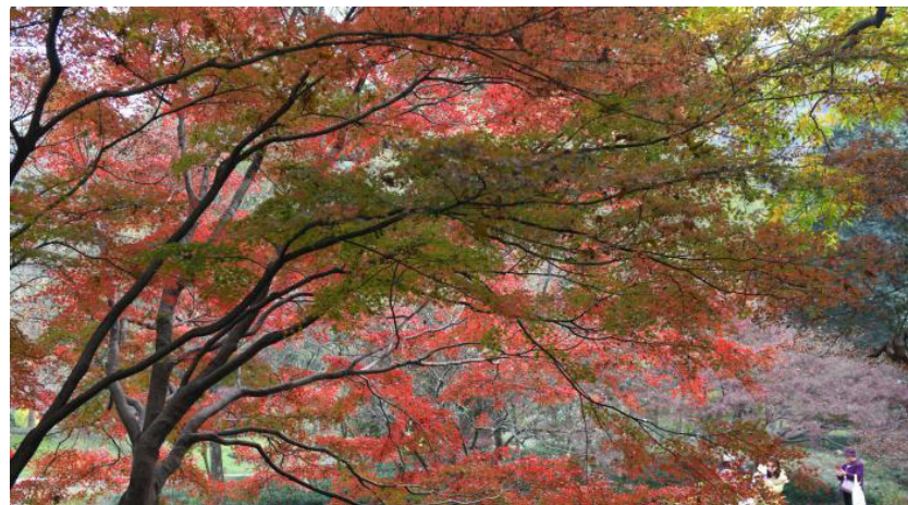
近日,浙江杭州西湖南山路、雷峰塔、花港观鱼、太子湾公园等多处景点在冬季呈现出独特季节变化,斑斓景致令游人流连。图为太子湾公园的红枫吸引游客。