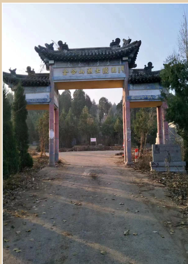
陈金合烈士纪念碑亭

乎比往日要亮。陈金合望着天空闪烁的晨星和匍匐在身后战壕的突击队战友，双手紧握拳头，牙咬得“咯咯”响，再次向连长请战：“再让我去一趟！我是共产党员，一定要把敌碉堡炸掉！”不等连长同意，陈金合一把将头上的帽子摘下塞到连长手里后，纵身跃出战壕，猫着腰避开了敌火力网，飞步向敌碉堡扑去。陈金合再次接近敌碉堡，在进入敌火力“死角”的一刹那，奋力爬上2米多高的碉堡台阶，抵近敌碉堡门楼，借着微弱的晨星光亮，很快找到并捡起他先前安放的那颗快速手雷。他一手握雷并用左肩将它抵在碉堡门上，一手拉开了引爆手雷的弦，在巨大的爆炸声和浓烟烈火中，敌碉堡被摧毁，乱石飞向黎明前的夜空……陈金合以自己的青春和热血，为战斗胜利作出了重大贡献，谱写了一曲惊天动地的壮丽凯歌。