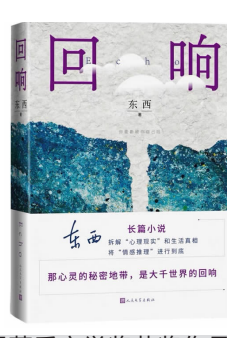
第十一届茅盾文学奖获奖作品