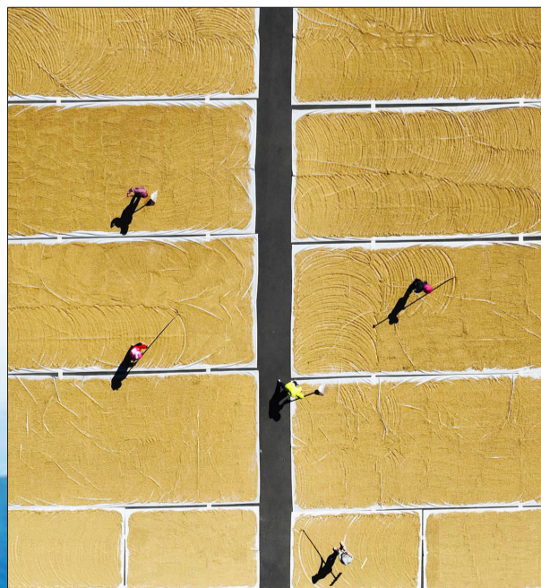
农民们正在晾晒稻谷,景美如画