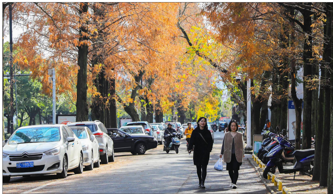
定海区环城东路,两旁的杉树叶已染成了红色,行人如同置身于风景画中