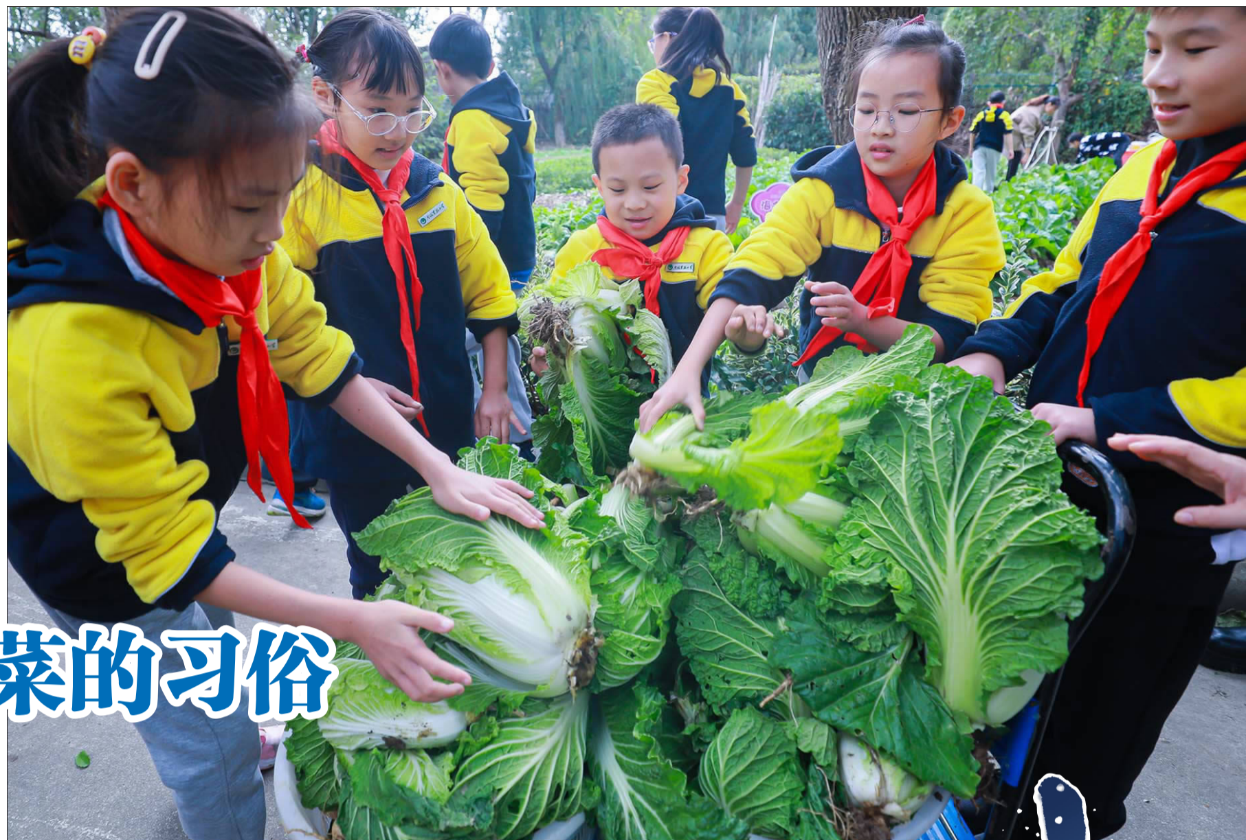
南海实验小学红领巾实践基地迎来白菜丰收