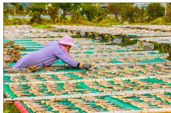
普陀观硃头,村民正在晒鱼鲞