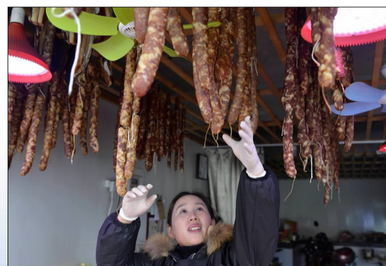
居民在店门前晾晒腊肉