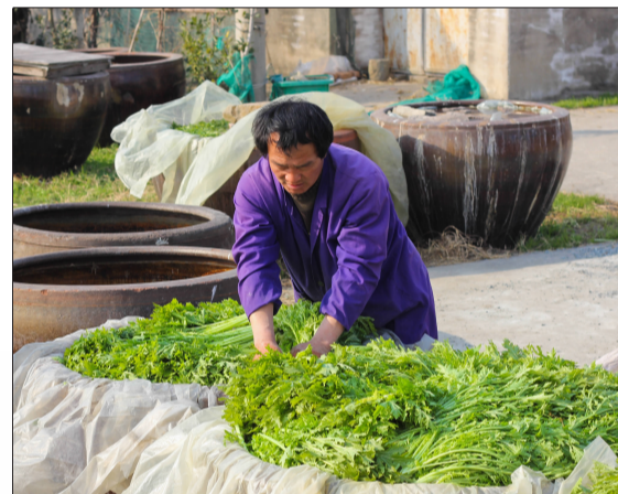
农户忙着腌制咸菜