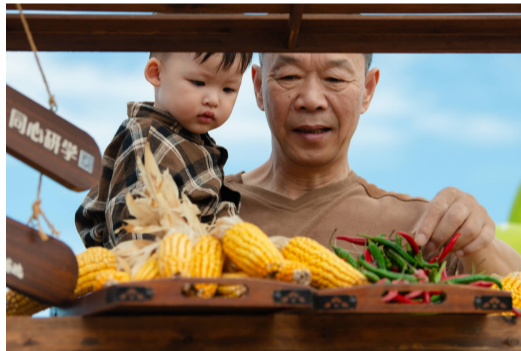
逛秋收展览

据了解,本次活动由市农业农村局、普陀区政府主办。作为活动举办地,展茅街道也展现了海岛和美乡村的新图景。近年来,该街道大力推进农业发展看展茅、农村游学逛展茅、农民创客来展茅,走出了一条具有海岛特色的乡村振兴之路。