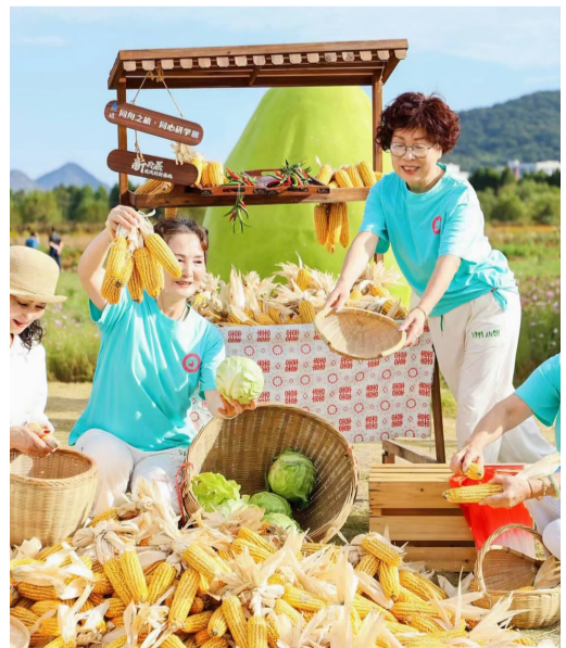
丰收的喜悦 图片由主办方提供