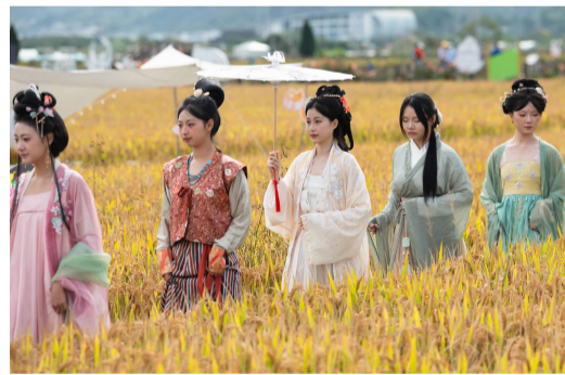
稻田汉服秀