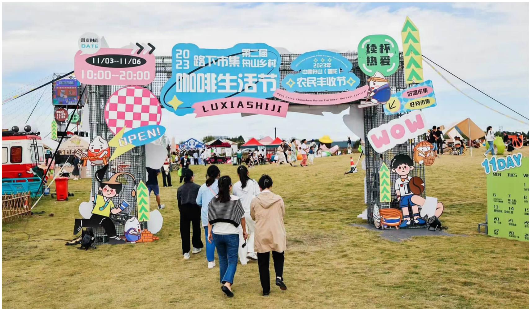
活动现场人气旺