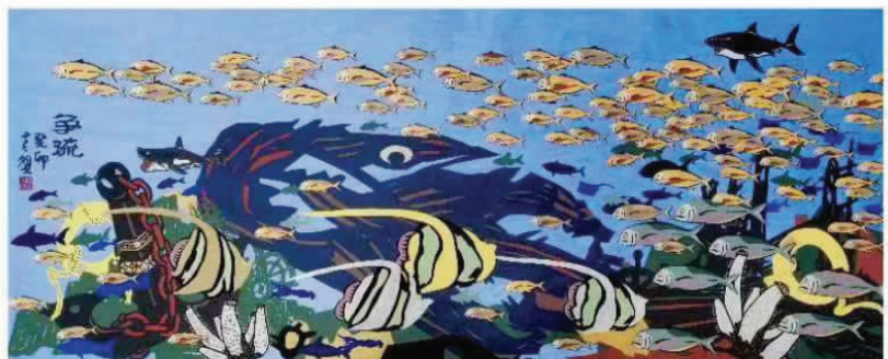
蟹哥套色刻纸作品：《争流》