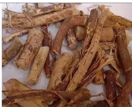
五指毛桃根 (常用药材)