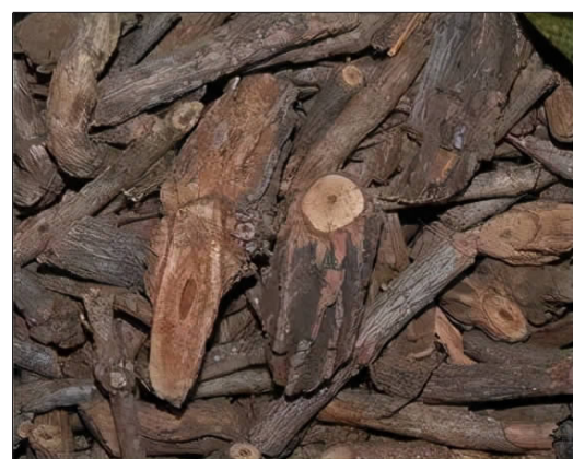
断肠草根 (不可食用)