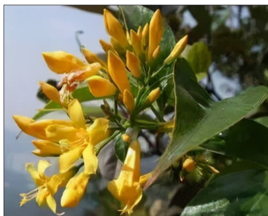
断肠草花 (不可食用)

此外,还有市民吃闹羊花中毒的。记者查阅百度了解到,闹羊花,别名黄杜鹃等,有毒,中毒症状为恶心、呕吐、腹泻、心跳缓慢、血压下降、动作失调、呼吸困难,严重者因呼吸停止致死。