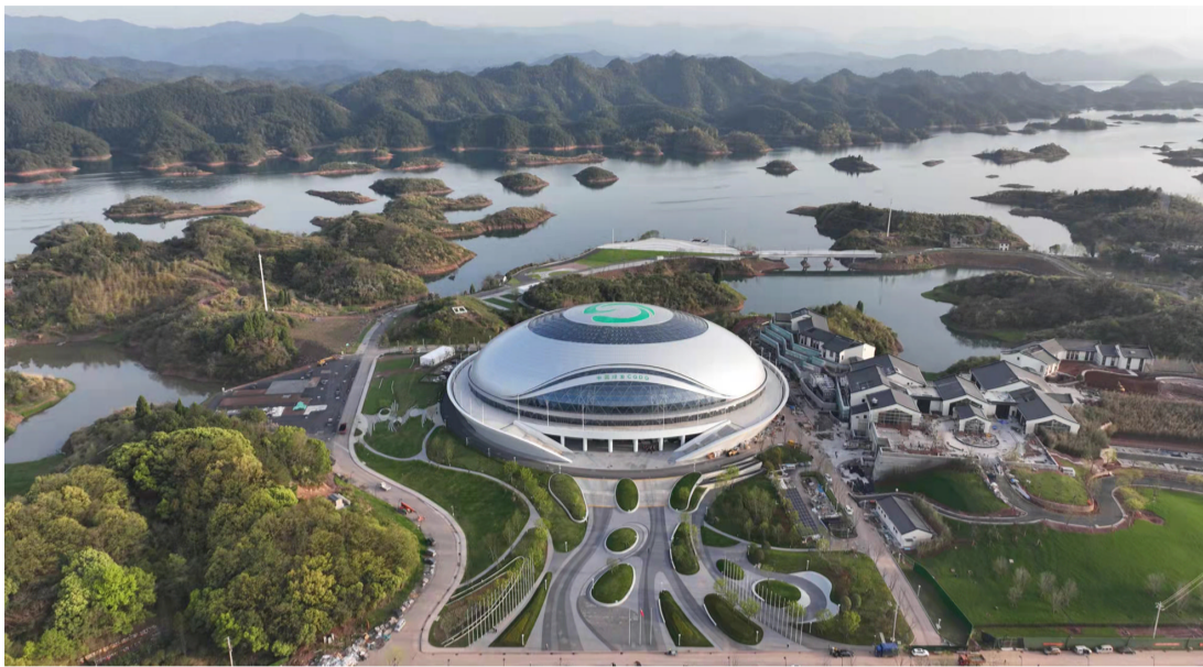
这是2022年3月28日拍摄的浙江杭州淳安界首体育中心自行车馆(无人机照片)

9月23日,象征丰收的农历秋分时节,杭州第19届亚运会将拉开帷幕,亚运之光闪耀西子湖畔。