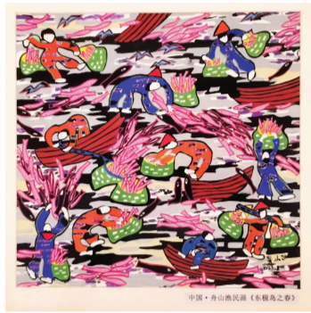
极岛之春》 吴小飞的渔民画作品《东