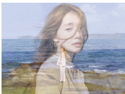
各地参与者拍摄的照片