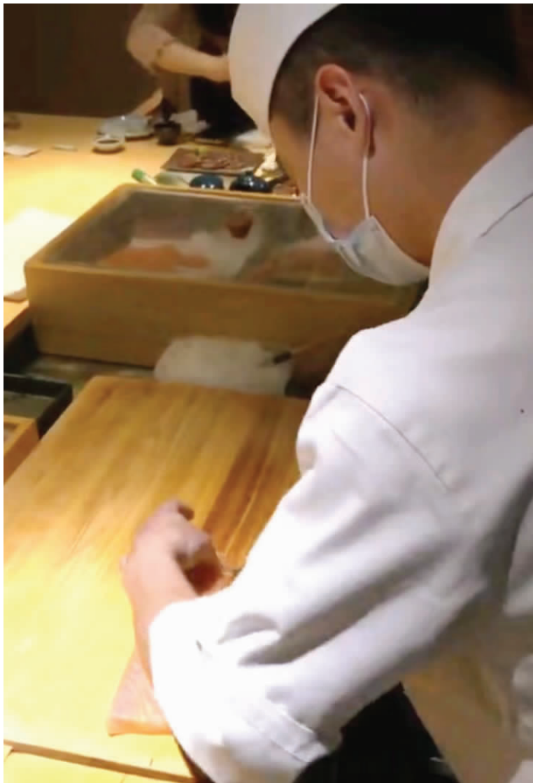
龙吟大江户店内,厨师正在制作日料