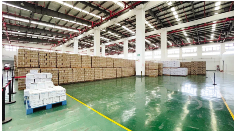
浙江舟山远东海盐制品有限公司生产仓库

8月24日,日本启动福岛核污水排海,引发全球广泛关注和热议。国内部分地区有市民效仿韩国民众开始囤盐,跟风“抢盐”“囤盐”现象在舟山也时有发生。