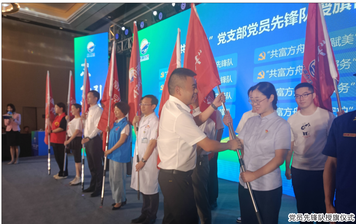
党员先锋队授旗仪式

“共富方舟·健康守护”是一场整体、全面的行动，让海岛共富的底色在普陀的山海之间不断铺陈。如今，“方舟”再度鸣笛起航，又将给普陀海岛群众带来什么样的福利？