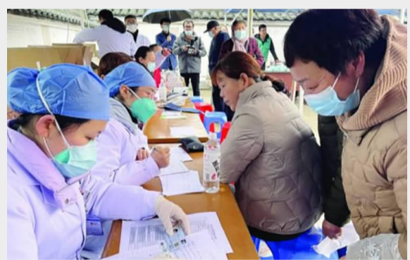
2023年“共富方舟·健康守护”行动首站走进展茅翁家乔 资料图