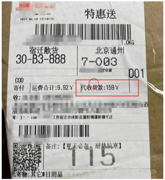
黑猫投诉网站截图