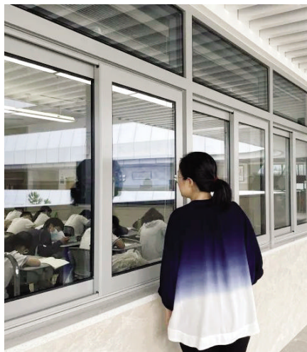
宋老师正在看学生上课