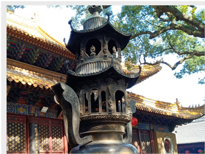
精巧庄重的光绪宝塔鼎

宝塔鼎周身刻着一大串的施主姓氏“各省各府各县乐助花名”，他们都为铸造这只精美的宝塔鼎而出资，乐助一元、两元的都有，估计有上百位的善男信女。而排在出资人的第一位，还是一位近代史的著名人物。他就是被称为晚清时期上海滩“第一豪门”的盛宣怀。宝鼎上镌刻的是“信士盛宣怀助洋五十元”，但他还不是为