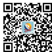
(舟山日报微信公众号)

据了解，此次演练主要对十余家联勤队伍配合进行全面磨合，并从演练中发现问题，从而完善应急处置预案、提升应急处置能力。