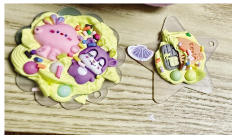
幼儿园毕业生做的咕卡