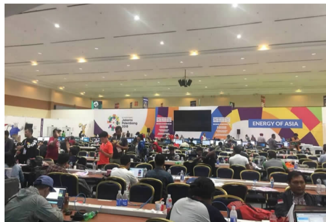
印尼雅加达亚运会主媒体中心