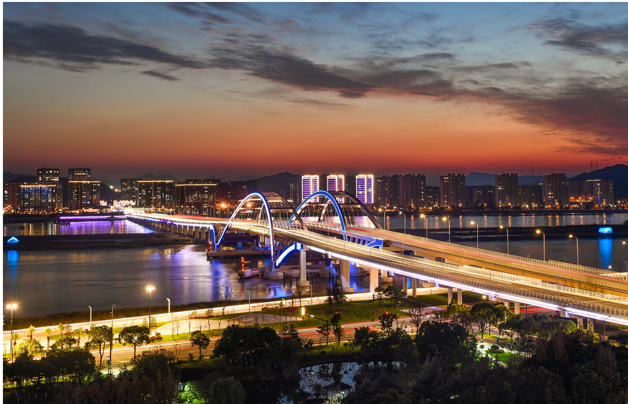
新城大桥夜景

长峙社区党支部书记何永存的脑海里，昔日进城的艰辛难以忘却。岛上物资有限，北岸有着300多年历史的王家墩渡口是大家进出岛的交通要道。对岸就是惠民桥，大家乘船过海后，在舟山本岛上班、采购商品、走亲访友。