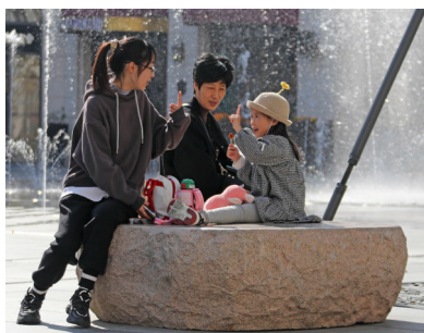
在长峙岛如心小镇广场，市民在“席地而坐”区域休闲